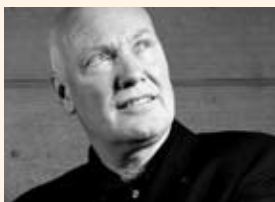
JEAN-CLAUDE BIVER MONTRES HUBLOT

● Quel «vrai» risque avez-vous pris dans votre vie?